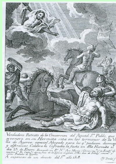
Verdadero Retrato de la Conversion del Apóstol S to Pablo, que se venera en su Hermita sita en los terminos de la Villa de Ayerbe, especial Abogado para los q os padecen de mague y aflicciones Coleras de Cofradia la Puerta en dita Hermita el dia 25. de Enero. Remido en el N o . An. Maria. y Otonio. y para el estudio de nuestra F. de Sancho y de las Flores se ganaron 1780 dias de Sancho y de Sancho. A expensas de un devoto del S to año 1808.